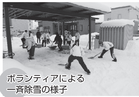
ボランティアによる 一斉除雪の様子