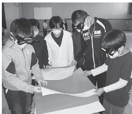
上富良野西小学校