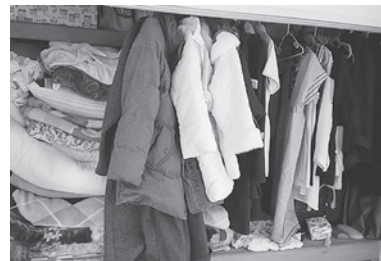
↑【イメージ】 押し入れの中の整理