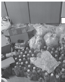
↑【イメージ】 溜まっているゴミの処分

年末の大掃除の際、「押し入れの中の整理」「衣替え」「溜まっているゴミの処分」「換気扇掃除」などはありませんか？おたすけサポーター活動でお手伝いすることができます！