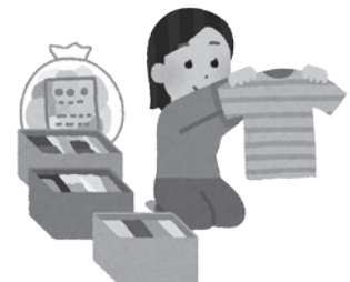
夏物、冬物の衣替えのお手伝い

上富良野町生活支援体制整備事業では、今後、地域の高齢者の方へ生活や困りごとについての聞き取り活動や生活課題に関する再調査を行っていきます。