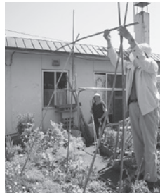
アサガオの支柱立て