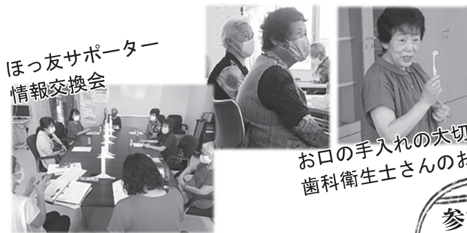
ほっ友サポーター 情報交換会